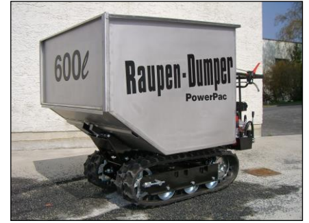
Leichtgutwanne 600 ltr.