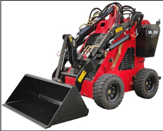
Optional mit Räder